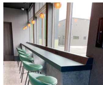
③ 待合室カウンター (コンセント、USBあり)